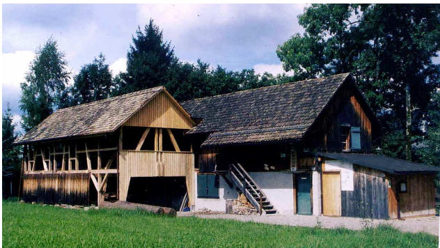
Alte Sagi Stockrüti >