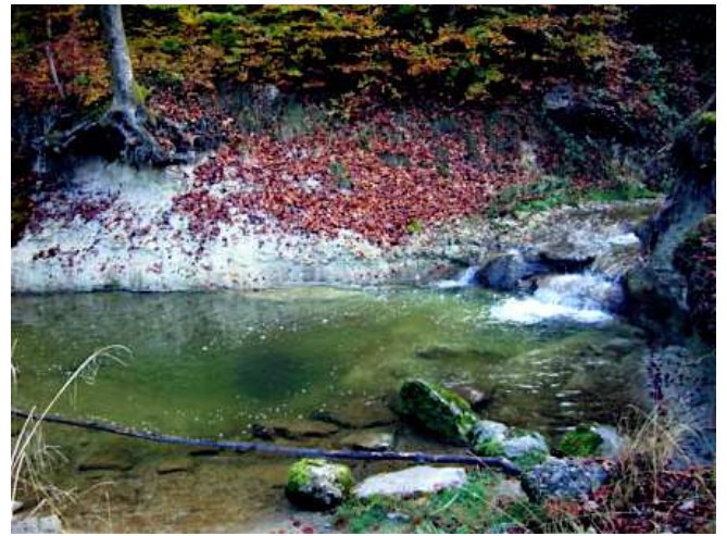
Giessen im Herrenwäldli/Aabachtobel