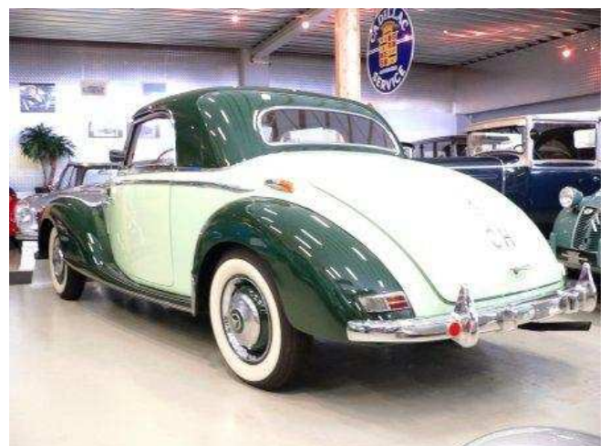
Hochkarätiger Veteran im Fahrzeugmuseum