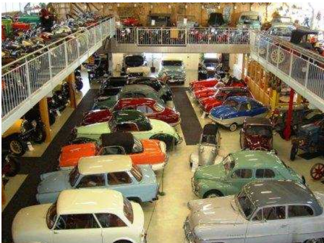
Fahrzeugmuseum: Innenansicht der Haupthalle mit Galerien >