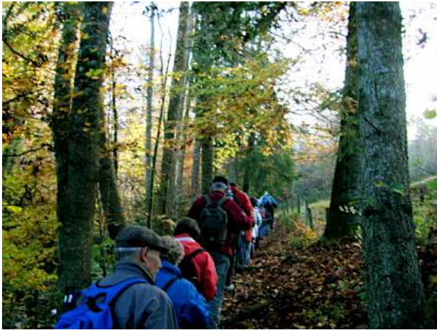
Einstieg ins Aabachtobel >